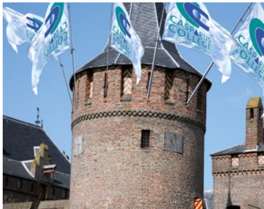
Casparus verovert het muiderslot april 2010